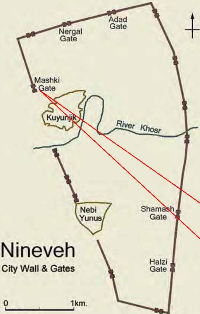
Nineveh City Wall & Gates